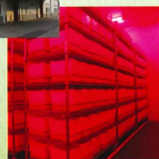
マルハナバチ飼育室